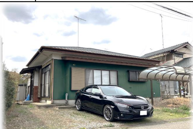
掲載写真 2024年4月撮影 現地土地 南東側より撮影 ※街並み含む